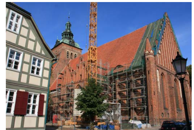
St. - Marien: August 2009, kurz vor Abschluss der Dachsanierung

1. Sommerfest der Bürgermeister der AG am 5. August 2010 in Wittstock/Dosse