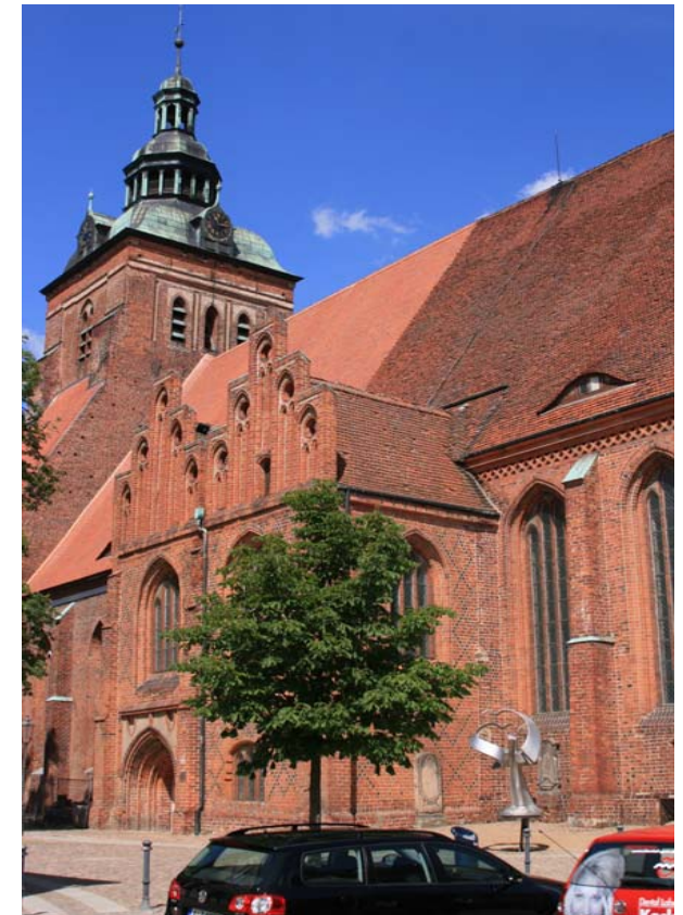
St. – Marien, Juni 2008