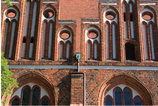
St.-Marien – Detail des Giebels der Südkapelle, Juni 2010

1. Sommerfest der Bürgermeister der AG am 5. August 2010 in Wittstock/Dosse