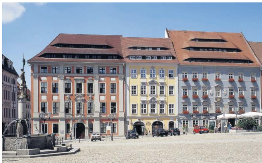
Würden die Sparpläne des Bundes und die Änderung des sächsischen Denkmalschutzgesetzes wahr, wären solche Bilder bald nur noch Erinnerung: Bautzen 2010

Das Programm Städtebaulicher Denkmalschutz ist die baupolitische Erfolgsgeschichte der letzten Jahrzehnte schlechthin: Von den bisher in Ostdeutschland eingesetzten knapp zwei Milliarden Euro Bundesfinanzhilfen und den Komplementärmitteln der Länder und Kommunen haben fast zweihundert historische Stadtkerne profitiert. Untergangsgeweihte Baudenkmale wurden mustergültig restauriert, Straßenzüge und Plätze aufgewertet, entstellte Ensembles zu Schmuckstücken. Dank dem