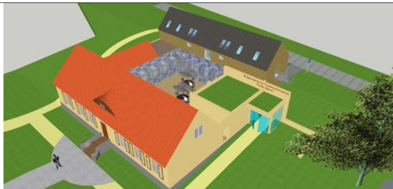
Bild nach Sanierung