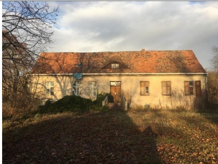
Bild vor Sanierung

Höhe des Einsatzes von Fördermitteln 80% ca. 2.160.000€