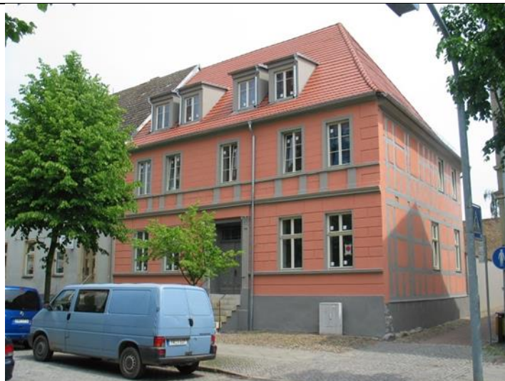
Bild nach Sanierung