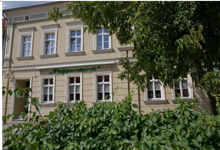
Bild nach Sanierung

Dateiname Schliebener Straße 12 nach der Sanierung