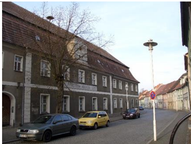
Bild vor Sanierung

940.000,00 € für Vorderhaus (Einzeldenkmal) und Mehrfamilienhaus