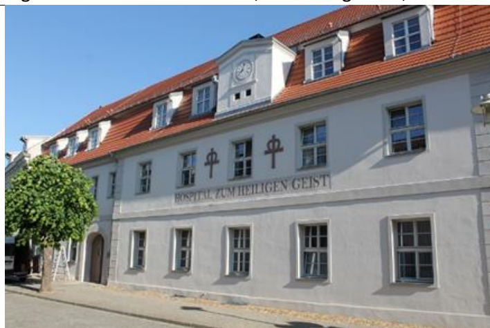
Bild nach Sanierung