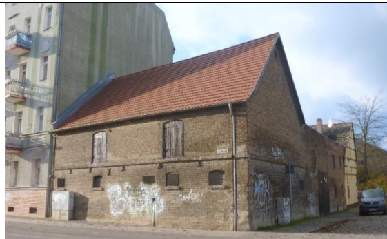
Bild vor Sanierung