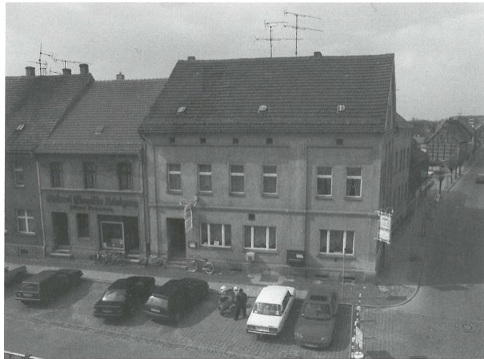
Bildautor Jürgen Tomisch